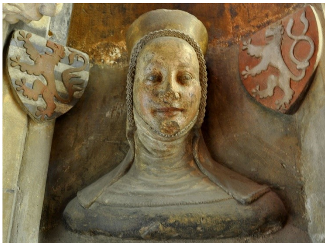
Eliška Přemyslovna (1292 – 1330) Vilém Zajíc z Valdeka (+1319)