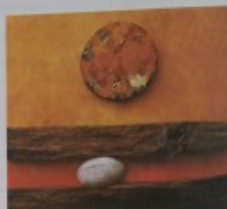
Oto Jonedek: Sládkovičev

Malý princ je člověk z fantastické planety, který putuje po Zemi a na ní poznává neznámé „planety“ lidského života.